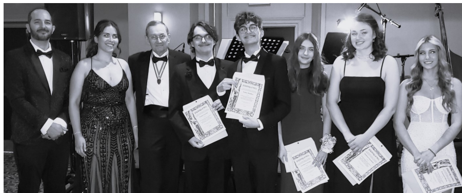
Ludányi pályázat oklevél osztás